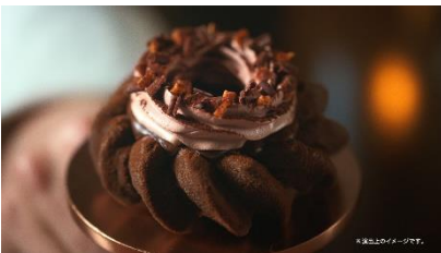
ガトーショコラ ドーナツに