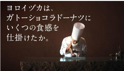
いくつかの食感を 仕掛けたか。