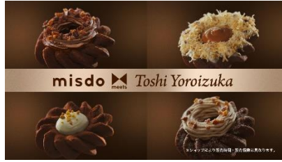
NA) ミスドミーツ トシ ヨロイツカ