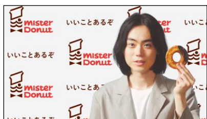
菅田さん V.I.) ミスタードーナツ♪