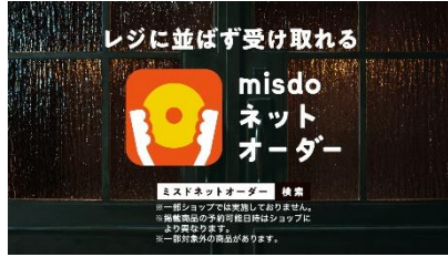
菅田さん OFF) ネットオーダーでも どうぞ。