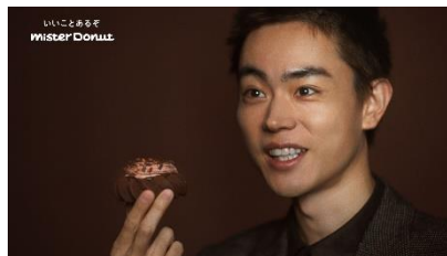
菅田さん) これが ヨロイツカ式。